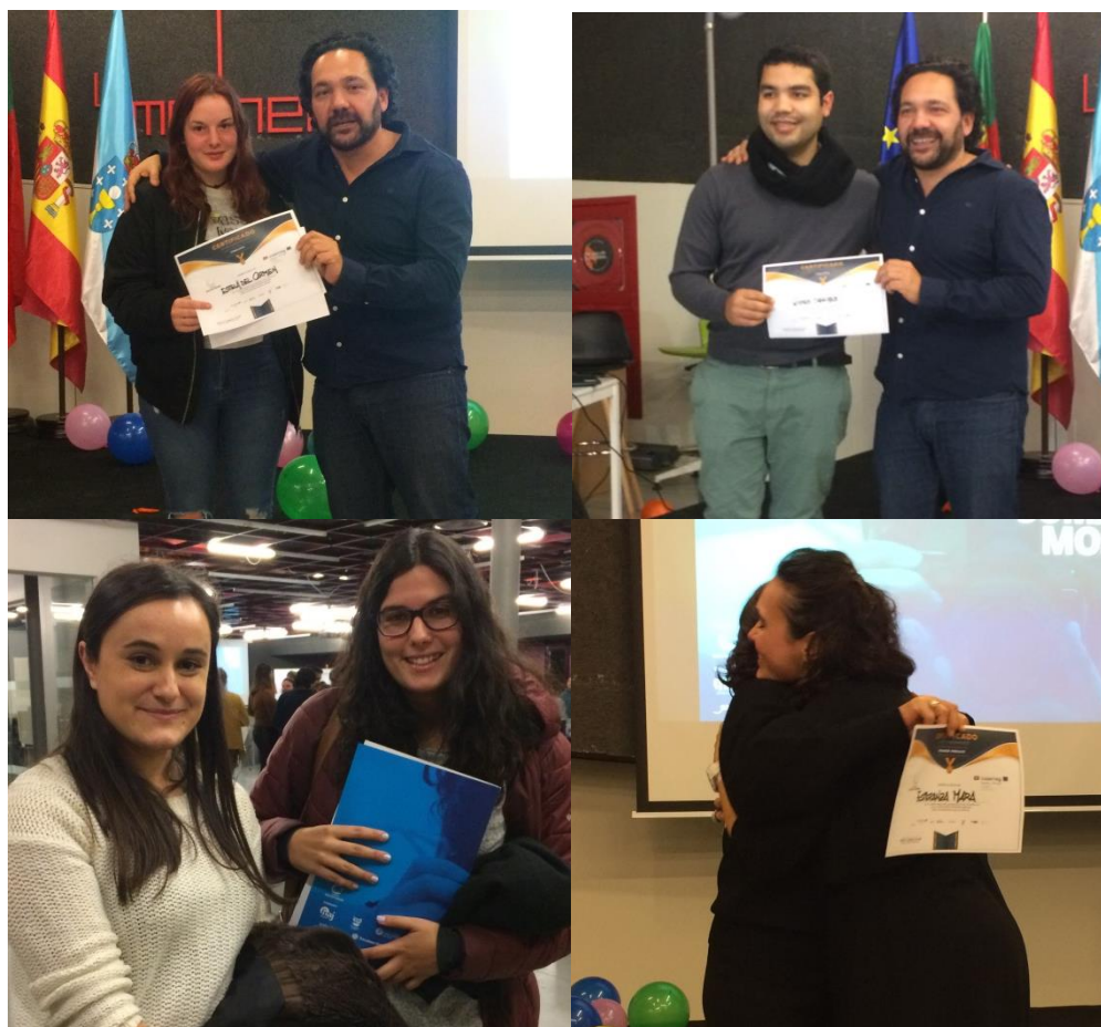
Os premiados gozarán de mentorías personalizadas e material promocional para os seus proxectos

recibiron, como recompensa pola súa creatividade, conveniencia e a capacidade para transmitir á audiencia a súa paixón, os servizos de apoio que ofrece LIDERA en forma de mentorías e material para facilitar a difusión do proxecto.