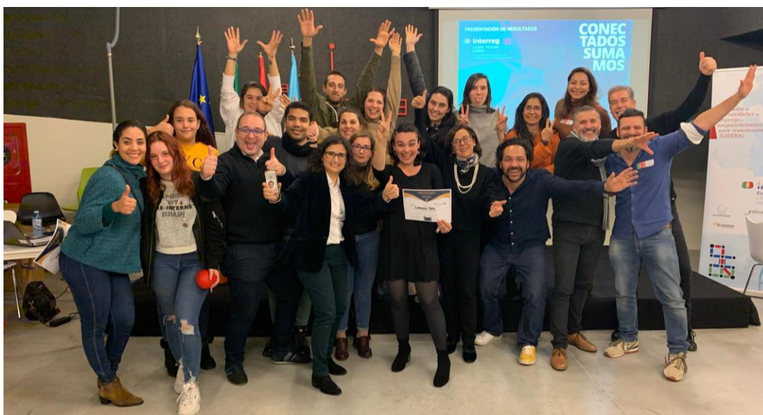
O ambiente de cooperación foi unha constante durante toda a xornada

O proxecto Catalizador de Oportunidades de Emprego e Emprendemento Xove Transfronterizo (LIDERA) comeza o seu esforzo integrador en 2016, froito do traballo conxunto da Dirección Xeral de Xuventude , a Fundación Galicia Europa , a Cámara de Comercio de Santiago , o Instituto Português do Desporto e da Juventude (IPDJ) e a Federación Nacional de Asociaciones Juveniles Portuguesa (FNAJ) . Este consorcio de entidades decátase da necesidade de fomentar o desenvolvemento económico transfronterizo na eurorrexión Galicia-Norte de Portugal; deciden unirse e embarcarse nun proxecto que apunta directamente á mocidade como motor de cambio no territorio.